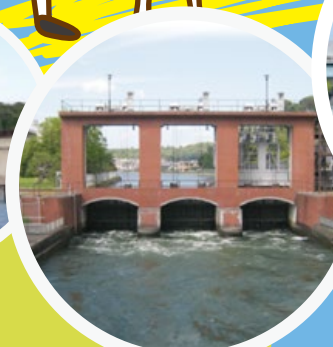
宇治発電所石山制水門